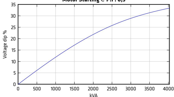
Motor Starting @ P.F. 0,3